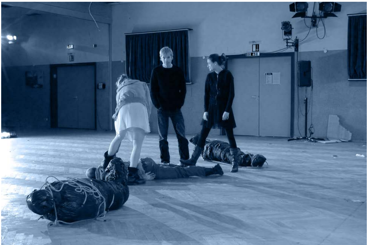
Probe zu "Skin Deep Song", Essen 2013

für 10 Bläser und 2 Schlagzeuger (1990/2003) 10', Partitur, Einzelstimmen Aufnahme der revidierten Fassung ohne Schlagzeug mit dem Orchester des Staatstheaters Darmstadt 2003