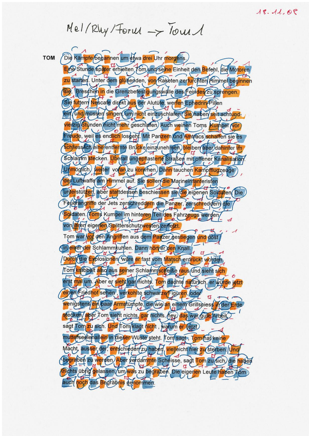
Skizze zu "Mein Bruder Tom", Theatermusik, Tübingen 2008 (21 x 30 cm)