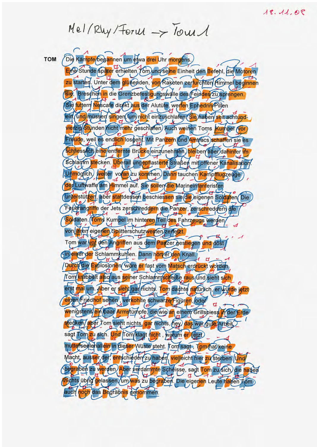
Skizze zu "Mein Bruder Tom", Theatermusik, Tübingen 2008 (21 x 30 cm)