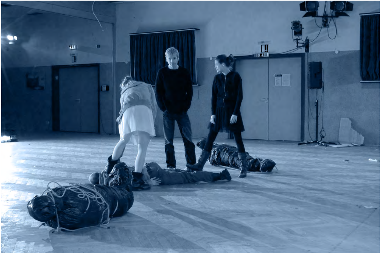
Probe zu "Skin Deep Song", Essen 2013

Aufnahme der revidierten Fassung ohne Schlagzeug mit dem Orchester des Staatstheaters Darmstadt 2003